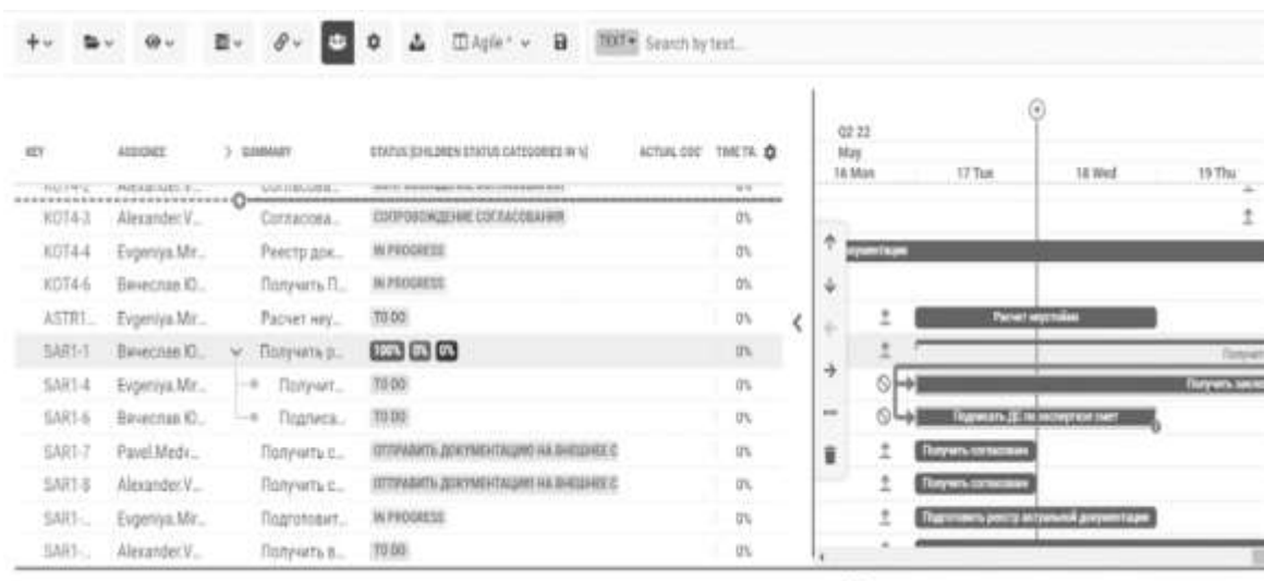
Рисунок 3. Диаграмма Гантта