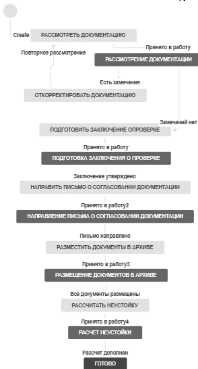
Рисунок 4. Пример индивидуальной схемы бизнес-процесса.

Программное обеспечение «Jira» имеет ряд аналогов, которые в той или иной степени позволяют также осуществлять эффективное управление проектом. В таблице 1 приведен сравнительный анализ наиболее известных аналогов программного обеспечения «Jira».