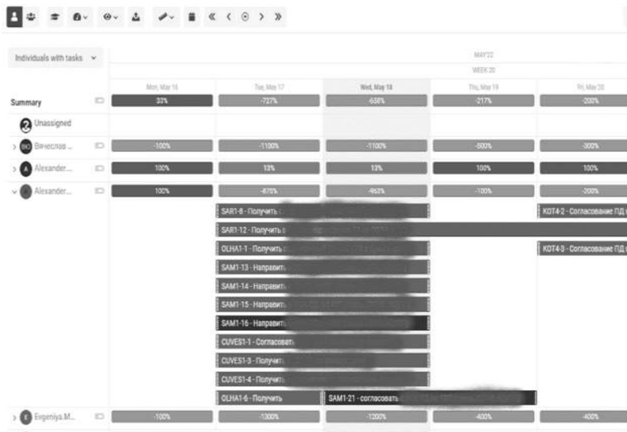
Рисунок 5. Ресурсная диаграмма

Пример ресурсной диаграммы проекта, представлен на рисунке 5.